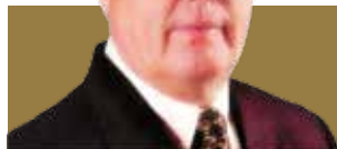
AFOCAPI SICOOB COCREFOCAPI SINDIRPI